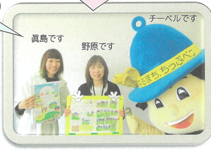
＼ちっぷつながりサポーターです／