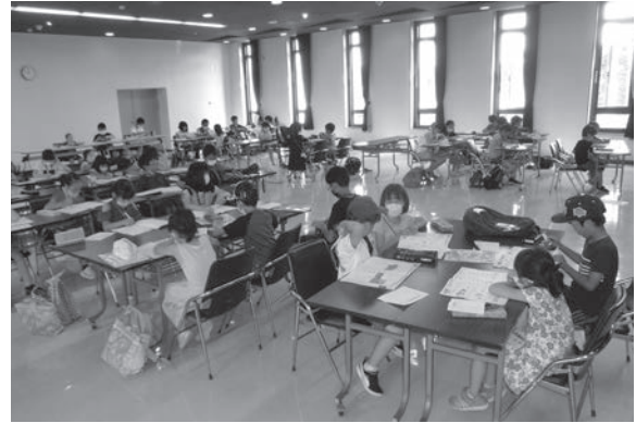
真剣に自習しています

毎日8時30分に集合し、ラジオ体操・論語の素読からはじまり、自習・読書やミニレクリエーションの時間を過ごし、「水泳教室」にも参加しました。