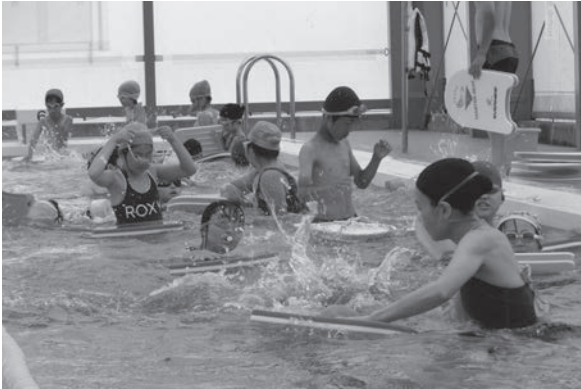
上手に泳げたかな？

また、6日には奉仕活動として、水泳教室前に小学生によるB&G海洋センター周辺のゴミ拾いを行いました。