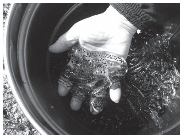
平成30年5月に確認されたアズマヒキガエルの卵 (1か所で15kgを捕獲)

生息状況等確認のため、アズマヒキガエルの異常発生を発見したときは、役場住民課総合窓口グループまでご連絡ください。