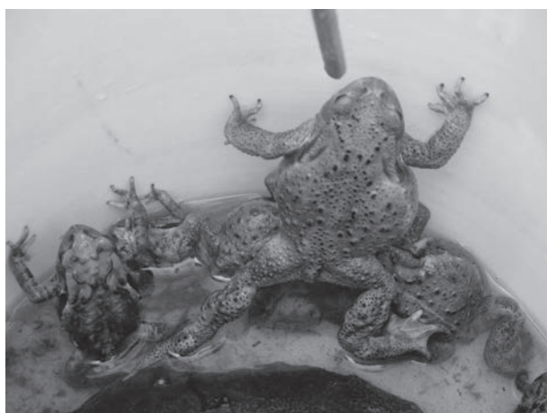
令和元年8月に捕獲された成体の様子

このカエルは人に危害を加える生き物ではありませんが、皮膚のイボ(耳腺 じせん)などから白色の毒を出し、素手で触るとかぶれたり、口など粘膜に入ると痛みや嘔吐の症状が現れるため、 見つけても素手で触らず、触った場合はよく手を洗うように注意してください。