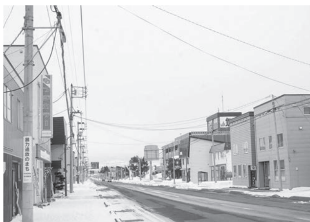
早く日常が戻りますように

秩父別町のことをPRしたり、観光客を呼ぶことができず私の仕事はかなり影響を受けましたが、この感染症がなくなったら、また世界中に向けて全力で宣伝していきたいと思います。