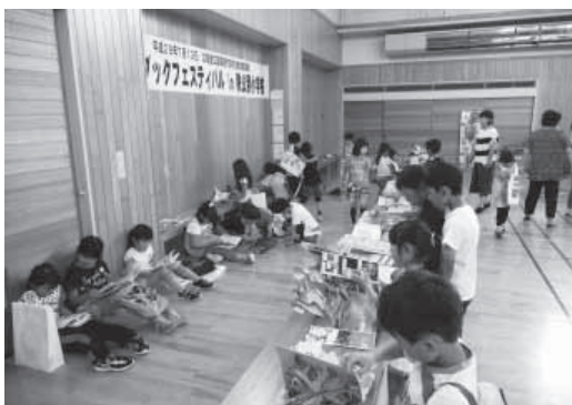
たくさんの仕掛け絵本に、子どもたちも興味津々