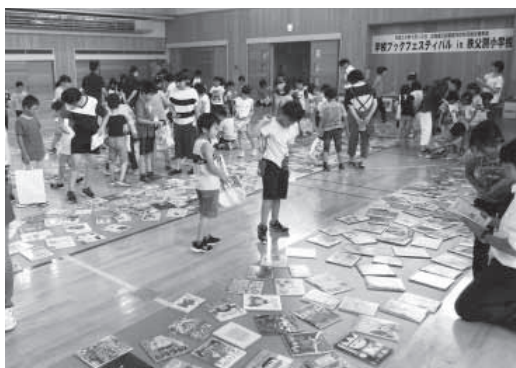
800冊の本でつくられた本の川(?)は壮観です