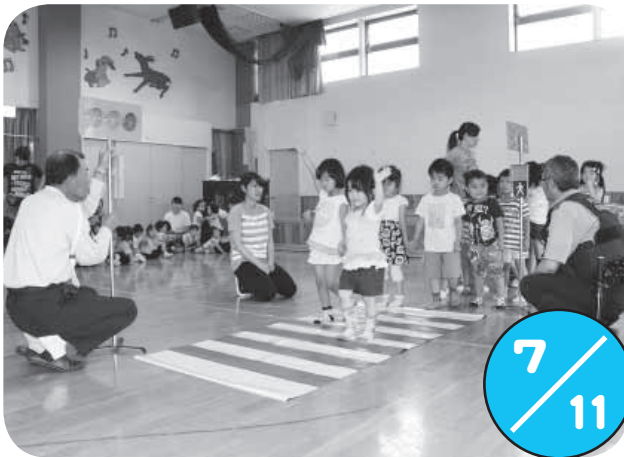
認定こども園で交通安全教室が行われ、模擬横断歩道やミニ信号機を使って、道路の渡り方を練習しました。信号が青になってもすぐに渡らずに、しっかりと左右を確認。手を大きく挙げて道路を渡る「安全ルール」を学びました。