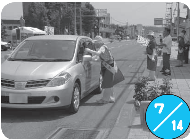
国道233号線沿いの旧消防庁舎跡地で交通安全24時間特別啓発が行われました。日赤奉仕団やまびこの会のメンバーも参加し、米が入った小袋「スピード出す米（まい）」とお茶をドライバーに手渡して、交通安全を呼びかけました。