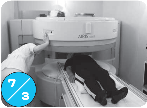
MRI装置（磁気共鳴画像診断装置）を使用した脳検診が老人福祉センターで行われました。この検診の定員は100名で、7月3日から3日間にかけて、全国で1台しかないMRI装置搭載の大型トレーラーを使用して行われました。

広報に掲載した写真をご希望の方、広報に関するご意見ご要望は、総務課総務グループ（広報担当）までご連絡ください。 ※写真は電子メール送信による提供も可能です ・電話 33-2111（内線34番） ・メール kouhou@chippubetsu.jp