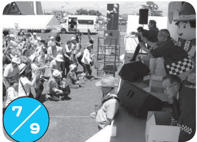
「ちっぷフェスティバルinローズガーデン」がふれあいプラザ横の広場で行われ、出店や歌手のステージショーを楽しむ人たちで賑わいました。最初に行われたもちまきでは、「こっちにも投げて」と大きな歓声が飛び交いました。