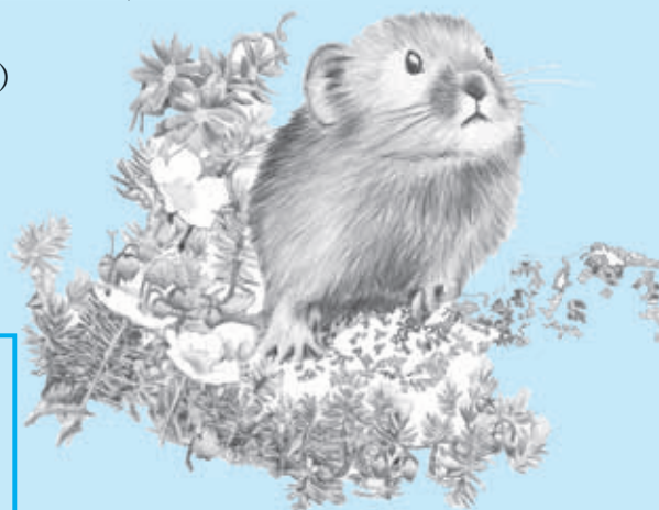
『なきうさぎのビッチ だいじょうぶ』/芸文社

1951年北海道十勝生れの画家・絵本作家。 自然や動物たちの世界に魅せられて絵本を作り続ける。著書に「海をわたるしかたち」「エトピリカノ海」（偕成社）、 「どさんこうまのふゆ」（ベネッセ/芸文社）など。北海道上川郡清水町在住。