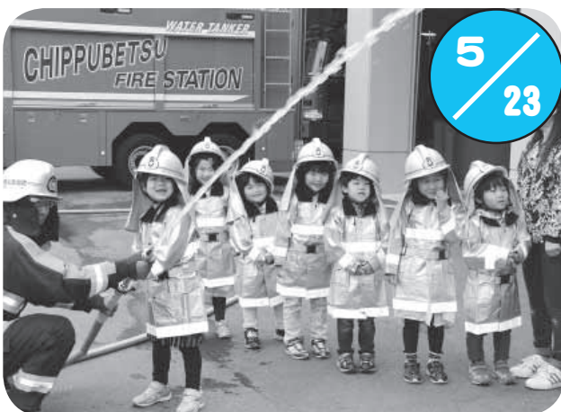
認定こども園くるみの園児が消防秩父別支署を訪れ、消防車両の見学などを行いました。23日・25日・29日の3日間で組ごとに分かれて見学をし、園児たちは大きな消防車に興味津々の様子で放水体験などを行いました。