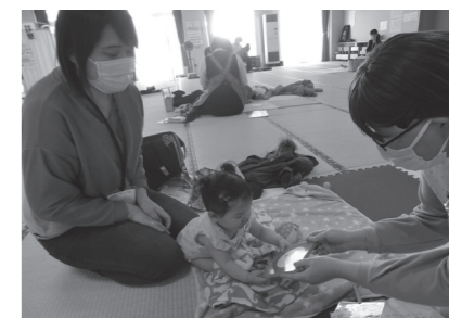
はいどうぞ！ おうちで楽しんでね

本の楽しさに触れる機会を提供し、成長してからの読書習慣の定着につながるよう、図書館から乳児と保護者に絵本をプレゼントしました。