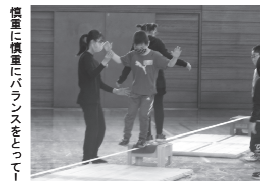
慎重に慎重にバランスをとって！