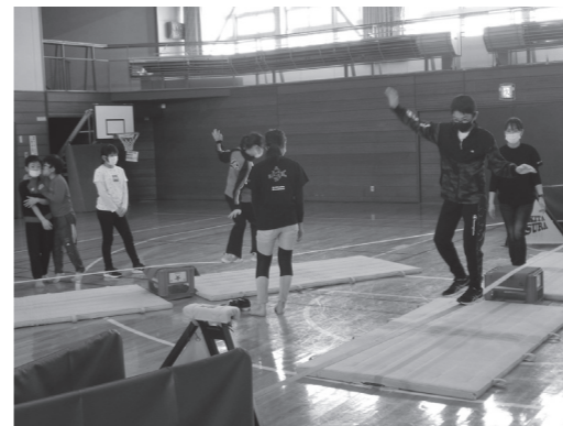
頑張って渡りきろう！

今回の開催が3回目になり、経験者もあり、最初からスタッフの補助なしでチャレンジする児童・生徒も数名いて、限られた時間の中で初心者も経験者もそれぞれ上達したようです。