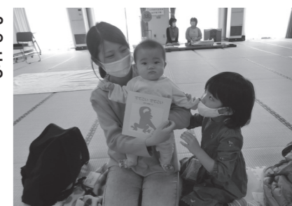
やったあ！ おもしろそうなんだ