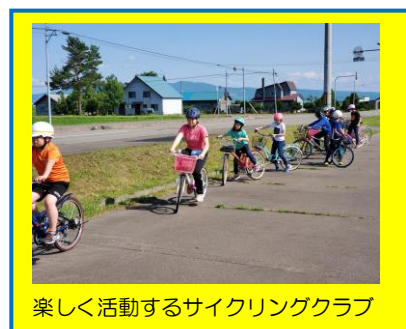
楽しく活動するサイクリングクラブ

最近、気温の高い日が続き、その中でも子供達は学習活動に取り組んだり、休み時間に遊んだりしながら、一生懸命活動しており、その姿に好感をもっています。その一方で、暑さによって集中力等を奪われ、一瞬の気の緩みが怪我につながることも予想されます。本校でも、子供達の健康観察や学習指導時には細心の注意を払いながら、今年の暑さを乗り越えていきたいと考えております。ご家庭におかれましても、お子さんの健康に留意いただくよう、お願いいたします。