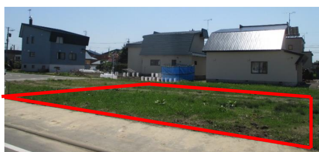
(和敬園裏側・ジャルダンアパート向い)