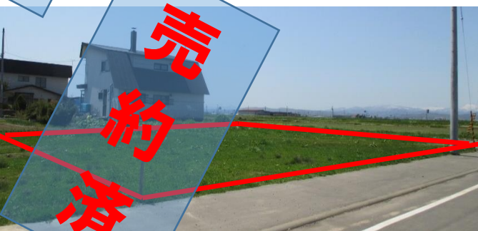
(和敬園裏側・ジャルダンアパート向い)