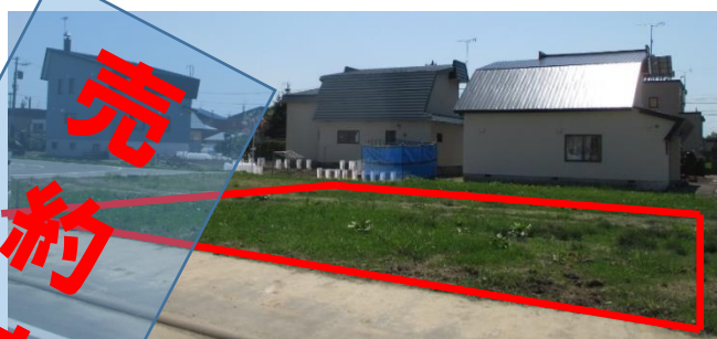
(和敬園裏側・ジャルダンアパート向い)