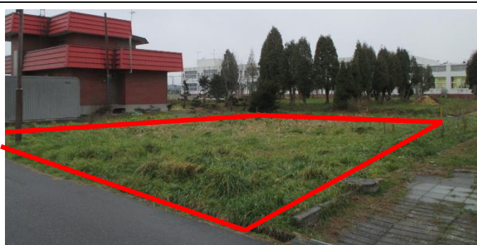
(秩父別中学校裏側)