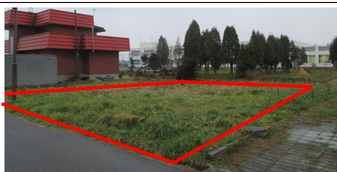
(秩父別中学校裏側)