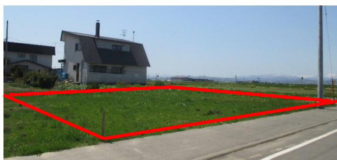
(和敬園裏側・ジャルダンアパート向い)