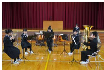
【2学期終業式での1コマ】

空知アンサンブルコンクールでは、管打七重奏で「波を越えてはるかに～吹奏楽のための祝典前奏曲」を演奏し、力を発揮することができましたが、銀賞という結果でした。