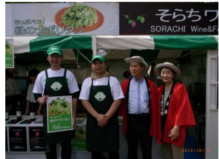
秩父別レストラン前で緑のナポリタンの販売応援をします