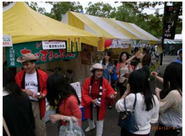
1本如何ですか？美味しいよ！