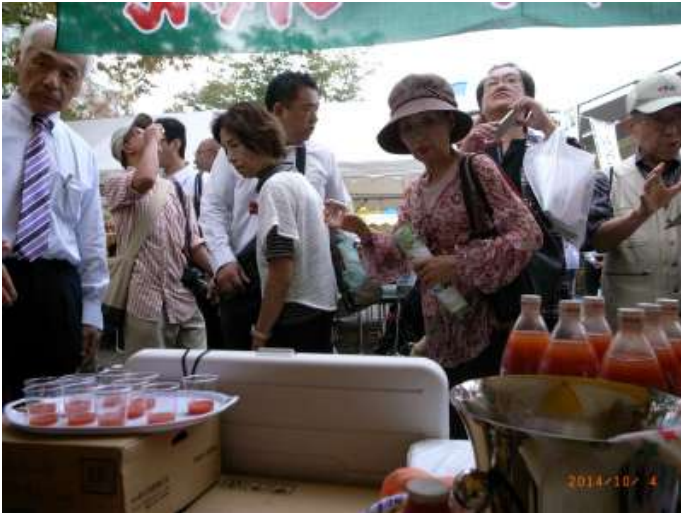
トマトジュースの試飲に1にも、2にも美味しいの一言。では買ってちょーだい！