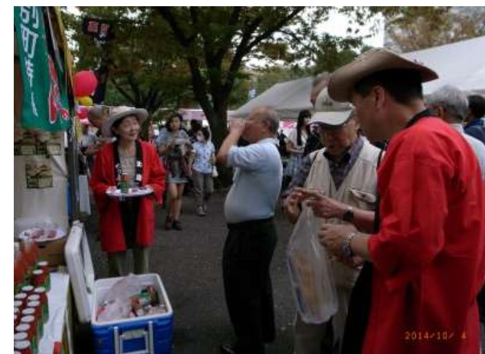
お父さん！トマトジュースは太鼓腹を改善しますよ・・・