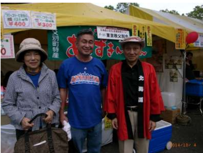
リピーターには誠心誠意の感謝をこめてありがとう・・・