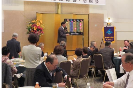
ビンゴが始まりビンゴカードを真剣に見つめる参加者