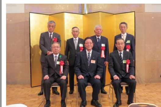
神薮町長と共にご来賓席の皆様の記念写真を撮影しました