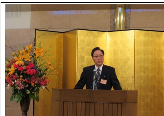
小熊一巳会長から開会の挨拶がありました