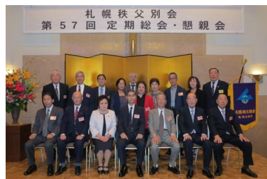
平成30年度札幌秩父別会新役員の皆さん