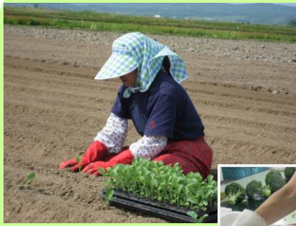
ブロッコリーの定植の様子