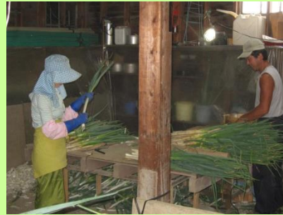
ネギの選別作業の様子