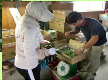
キュウリの収穫と箱詰め