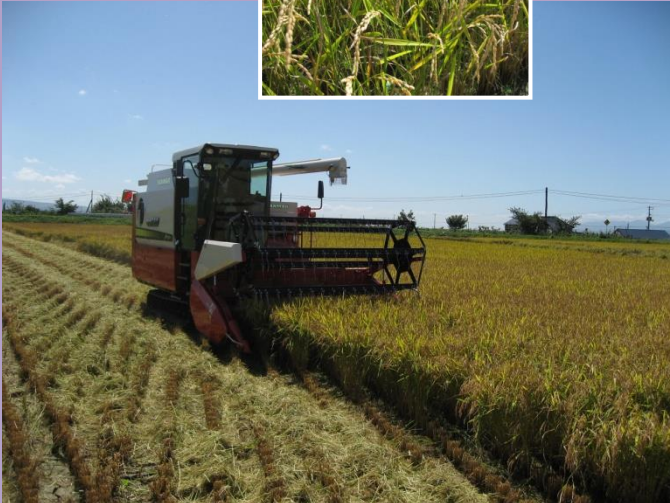
農家さんのお手伝いをして育ったものが食卓に… なんだかすごいことですね