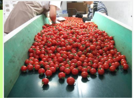
これも選果場。かわいらしく実りました