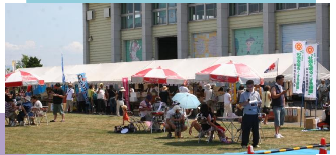
とんでんまつりでは JA 青年部に交じって出店

ご紹介できるのは、ほんの一部です。実際に秩父別町にいらして、たくさん のことを体験して頂ければ嬉しい限りです。