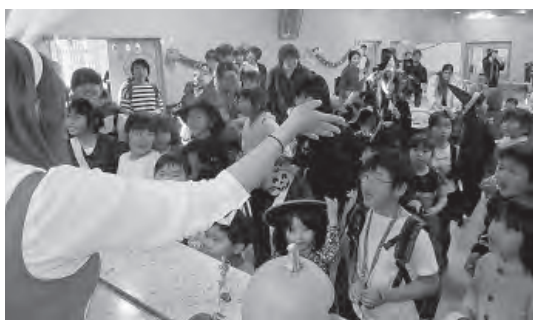
「トリックオアトリート」 はじめるよ!