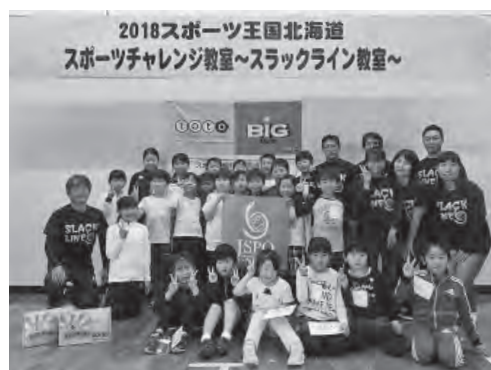
お世話になった指導員のみなさんと記念撮影