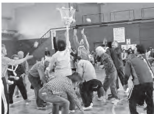
「接戦の中、最終種目の「紅白玉入れ」力が入ります！」

今年は、1位～3位までそれぞれ1点差の接戦でしたが、青組が見事優勝を果たしました。