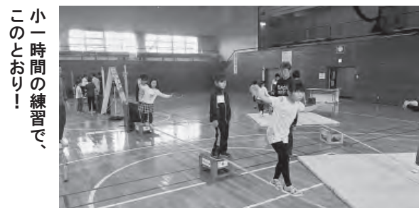
「小一時間の練習で、このとおり！」