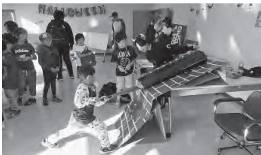
ゲームコーナーの様子 (ネズミ退治ゲーム)

～ Malice in Chippubetsu Land 2018.10.20 ～