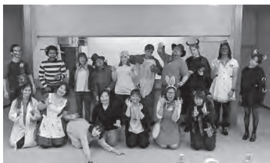
ご協力いただいた ボランティアのみなさん

10月20日(土)、町内の子どもたちを対象として、スポーツセンターの2階全てを使用して「マリスインチップベツランド」と題し、昨年に引き続きハロウィンイベントを開催しました。