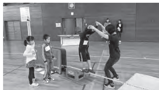
最初は補助をしてもらい感覚を掴みます。