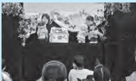
ぷちパンプキンによる人形劇の様子

この日は絵本の読み聞かせや布遊具・布絵本製作サークル「ぷちパンプキン」による人形劇「ヘンゼルとグレーテル」が公演され、参加した子どもたちは楽しいひとときを過ごしていました。