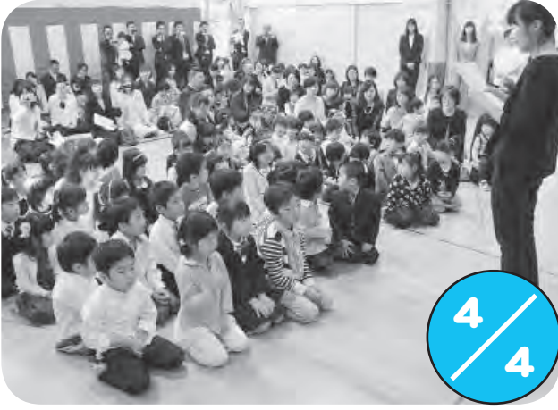
認定こども園くるみで入園式が行われ、67名の児童が入園しました。 大勢の保護者が見守るなか、組ごとに担任の先生から名前を呼ばれた児童は、大きな声で返事をしていました。

広報に掲載した写真をご希望の方、広報に関するご意見ご要望は、総務課総務グループ（広報担当）までご連絡ください。 ※写真は電子メール送信による提供も可能です ・電話 33-2111（内線34番） ・メール kouhou@chippubetsu.jp