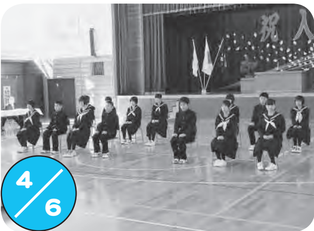
秩父別中学校で入学式が行われ、大勢の保護者や来賓が見守るなか、14名の新1年生が緊張の面持ちで中学校生活をスタートさせました。 式では、吹奏楽部の演奏で新1年生が入場し、2・3年生の合唱で歓迎しました。