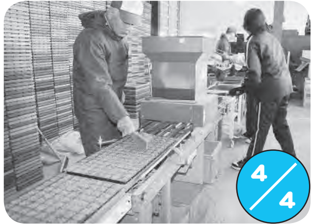
町特産ブロッコリーの種まき作業が育苗施設で始まり、指定管理者であるJA北いぶきの担当者により作業が行われました。この種まき作業は収穫が集中しないよう、7月まで時期をずらしながら計18回に分けて行われます。