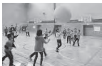
巨大なキンボールを使用したバレーボール

デザインの決定から実際に並べるまでを全てグループで行い、みんなで協力しながら完成させることができました。