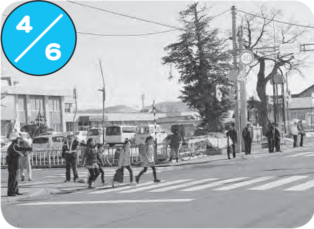
春の交通安全運動にあわせて、役場前交差点で交通安全街頭啓発が行われました。交通安全協会、交通安全指導員会、地域防犯パトロール隊、ライオンズクラブ、北垣建設の方々が安全旗を掲げ、交通安全を呼びかけました。