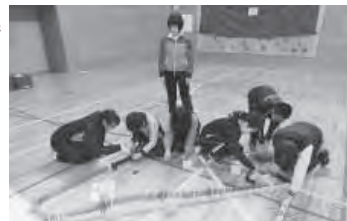
集中してドミノを並べる児童たち