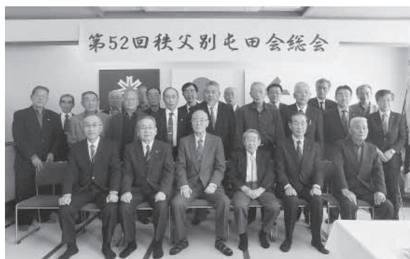
出席者による集合写真

総会の前段では、リボンの会による紙芝居「屯田兵物語」の公演があり、秩父別町を開拓した屯田兵の苦勞がしのばれる内容に、出席された方々も感慨深く聴き入っていました。