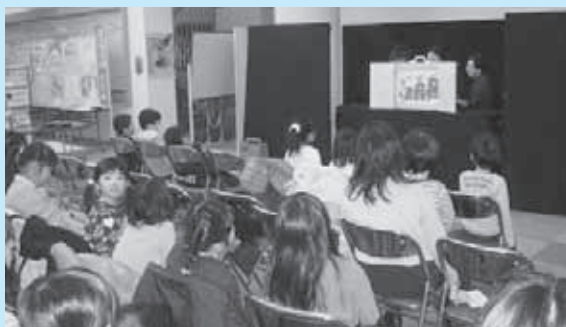
町内有志「リボンの会」による大型紙芝居 「三びきのくま」