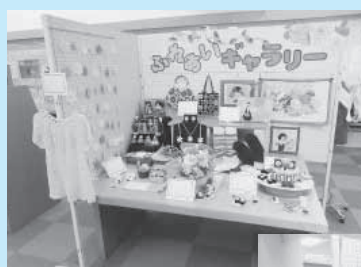
ふれあいギャラリー 展示は3月13日まで

また、館内では、町民の方々から募集した作品を「ふれあいギャラリー」として展示中です。