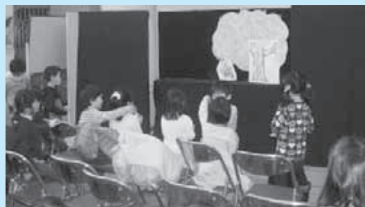
町内有志「ビックママ」によるペープサート (紙人形劇)「花さか爺さん」