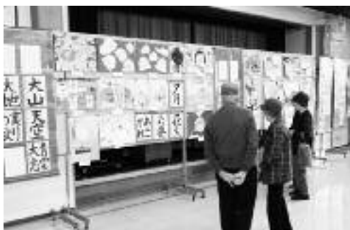
会場では姉妹町である綾川町の小中学生作品も展示されました

3日午前11時から中学校吹奏楽部による演奏やピアノの発表、午後からはダンスや詩吟などの芸能発表が行われ、客席から幾度となく大きな拍手がおくられていました。