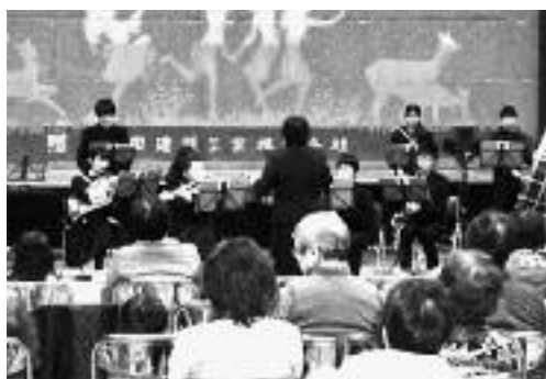
中学校吹奏楽部による演奏