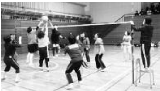
熱戦を繰り広げました