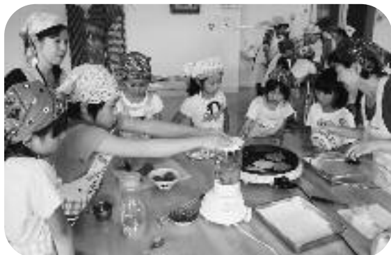
指導を受けながら料理に挑戦しています

この教室は、子どもたちに料理を通して食の大切さを伝えようと、食生活改善推進協議会がボランティア活動として実施しており、子どもたちは慣れない手つきながらも、会員の指導を受け、楽しく調理していました。