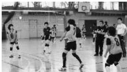
中学生の部 レシーブの方法を 学んでいます