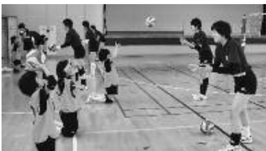
小学生の部 バレーの基礎を 学んでいます