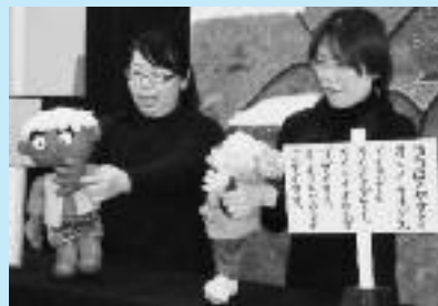
【昨年のおはなし会の様子】

■内容：☆絵本読み聞かせ『さかさのこもりくん』 ☆「ぷちパンプキン」による人形劇『かさこじぞう』 ☆ミニゲーム『クイズにこたえて トリック オア トリート』