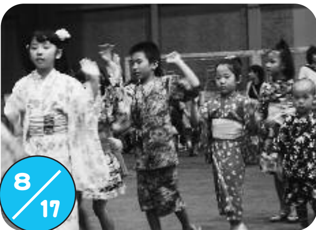
町観光協会主催の「ちっぷ納涼盆踊り大会」がふれあいプラザで行われました。 子どもの部と大人の部に分かれ、やぐらを囲みながら太鼓の音色に合わせて踊り、夏の夜を楽しんでいました。