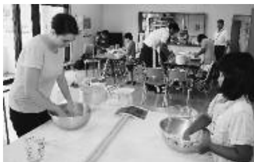
そば打ちの様子。エミリー先生も一緒に体験しました。

午後からは、郷土館オリエンテーリングを行い、郷土館の展示内容を題材とした問題を解きながら、郷土館を見学しました。