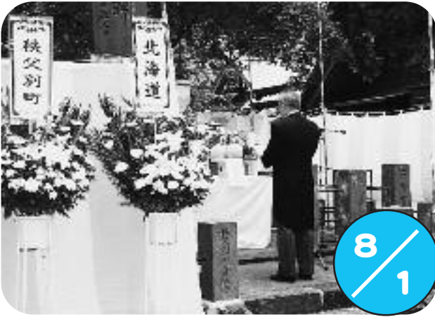
秩父神社境内忠魂碑前で戦没者追悼式が行われました。 遺族や来賓の方々が大勢参加され、平和への願いを込めながら、1人ずつ献花台に白菊を供えました。

広報に掲載した写真をご希望の方、広報に関するご意見ご要望は、総務課総務グループ（広報担当）までご連絡ください。 ※写真は電子メール送信による提供も可能です ・電話 33-2111（内線32番） ・メール kouhou@chippubetsu.jp