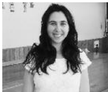
よろしく願います