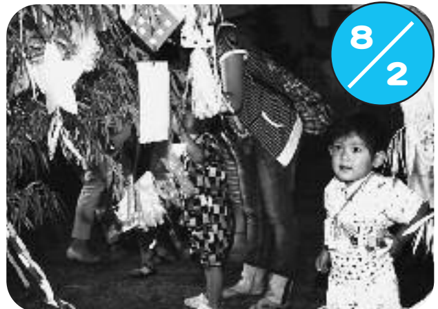
認定こども園くるみで七夕お楽しみ会が行われました。会場では、色とりどりの浴衣を着た子どもたちが盆踊りを元気に踊ったあと、「ヨーヨーすくい」や「ジュースのお店」でお祭り気分を味わい、最後に中学校グラウンドで花火をしました。