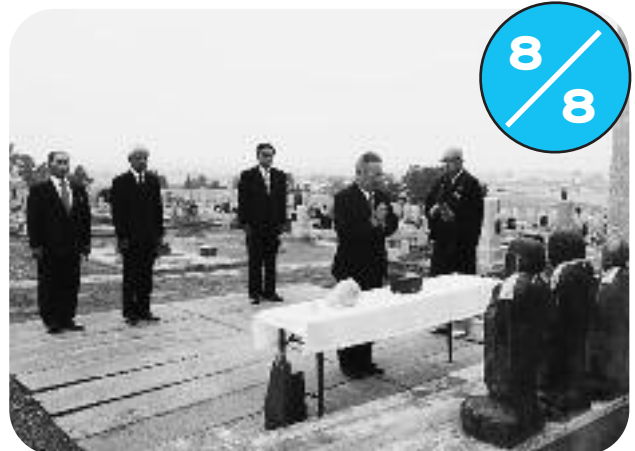
秩父別墓地内にある万霊供養塔で慰霊祭が行われました。神薮町長、柴田町議会議長、竹内社協会長、渋谷副町長が参列し、大光寺の梅澤住職とともに無縁仏及び開拓草創期諸精霊碑の物故者を供養しました。