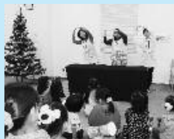
昨年のクリスマス おたのしみ会の様子

○クリスマスおたのしみ会（12月） 紙芝居や工作、ボランティアによる楽しいお話し会などを行います。