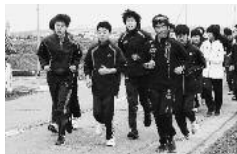
屋外でのランニングの様子。中学生は6キロ、小学生は3キロを走りました。