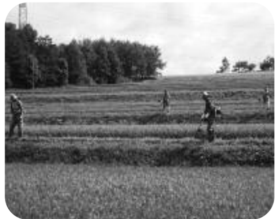
【共同作業による農地等の保全活動】