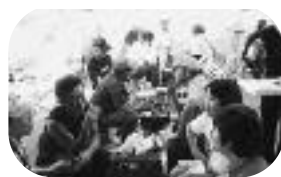
秩父別町企画課企画グループ