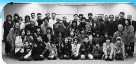
綾川町中筋の親子獅子舞の会員らと交流

今回、保存会では大人から園児まで33名が参加し、2月9日には綾川町、翌日の10日は観音寺市を訪れ、お互いの獅子舞を披露し合いました。特に観音寺市田野々地区の獅子舞はちくし獅子舞とよく似ており、会場では地元の方々からも驚きの声が上がっていたとの事です。