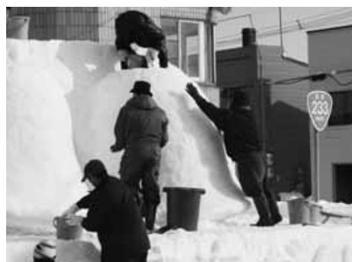
《協働隊のメンバーによる雪像づくり》