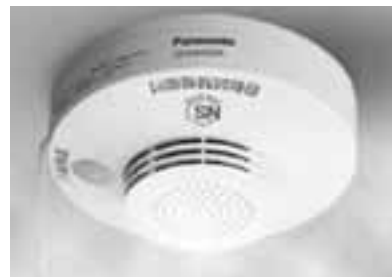
【火災報知機（電池式）】

・設置費用の3分の1以内とし、住宅1戸につき1万円を限度。（10円未満切捨） ・高齢者世帯（昭和16年5月31日までに生まれた方の世帯）は1台を無料設置。